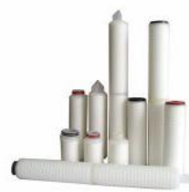
聚丙烯折叠式滤芯 (PP)