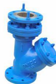
Y型拉杆伸缩过滤器 (YSTF)