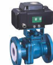
衬氟V型电动调节球阀 (VQ41F 46 -16C)