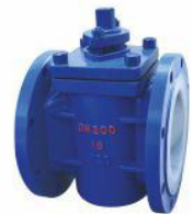
衬氟旋塞阀 (X43F 46 )