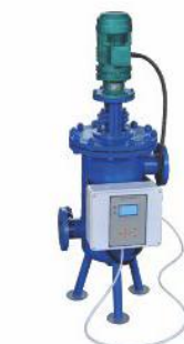
全自动清洗过滤器 I (ZQX)