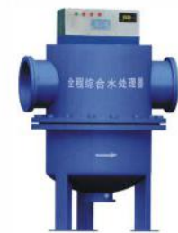
全程综合水处理器 (BVSK-QF)