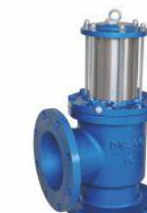
气动、液动角式排泥阀 (J744X(J44X)-1.0)