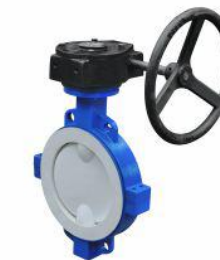
衬氟蝶阀 (D371F 46 -16C)