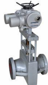
外置式电动管夹阀 (YGJ941X-6C)