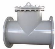
T型直通法兰连接式过滤器 (ST)