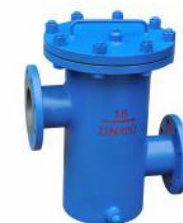
高低接管篮式过滤器 (SG-I)