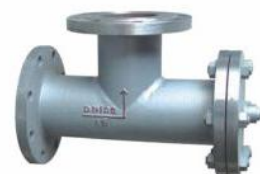
T型直角法兰连接式过滤器 (ST)