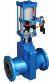
常开型气动管夹阀 (GJ6K41X-6Z)