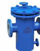
衬氟篮式过滤器 (SBL-F 46 )