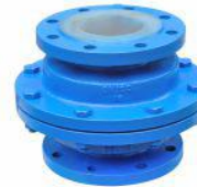
衬氟止回阀 (H42F 46 -16)