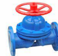
衬氟隔膜阀 (G41F 46 -10)