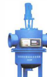
全自动全程综合水处理器 (BVSK-QZF)