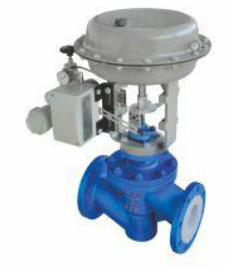
衬氟气动薄膜单座调节阀 (LKZH 46 -16)