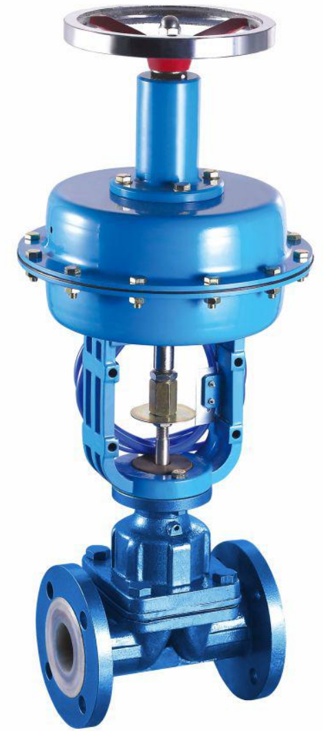
衬氟气动薄膜隔膜调节阀 (LKVT 46 -16)