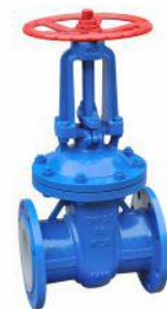
衬氟闸阀 (Z41F 46 -16)