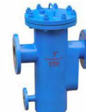
单桶直立式过滤器 (SG-II)