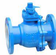
衬氟球阀 (Q41F 46 -16C)