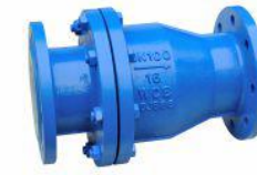
衬氟止回阀 (H44F 46 -16)