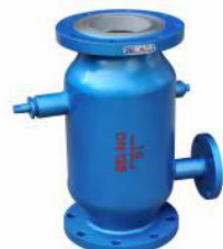
直通式自动排污过滤器 (ZPG-I)