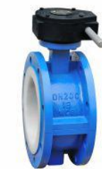
法兰式蝶阀 (D341F 46 -16C)