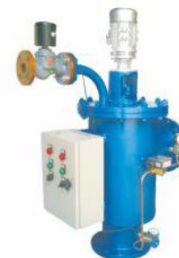
全自动清洗过滤器 II (ZQX)