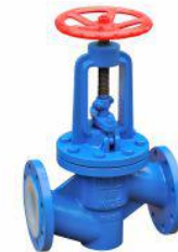
衬氟截止阀 (J41F 46 -16)