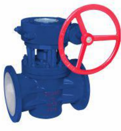
衬氟旋塞阀 (X343F 46 )