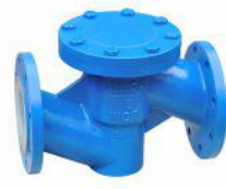
衬氟止回阀 (H41F 46 -16)