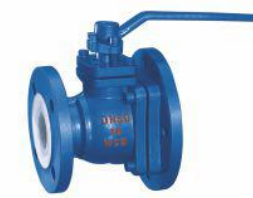
衬氟球型放料阀 (FQ41F 46 -16C)